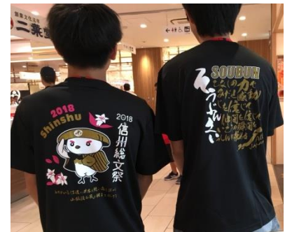
▲ 信州総文祭（2018 年夏）